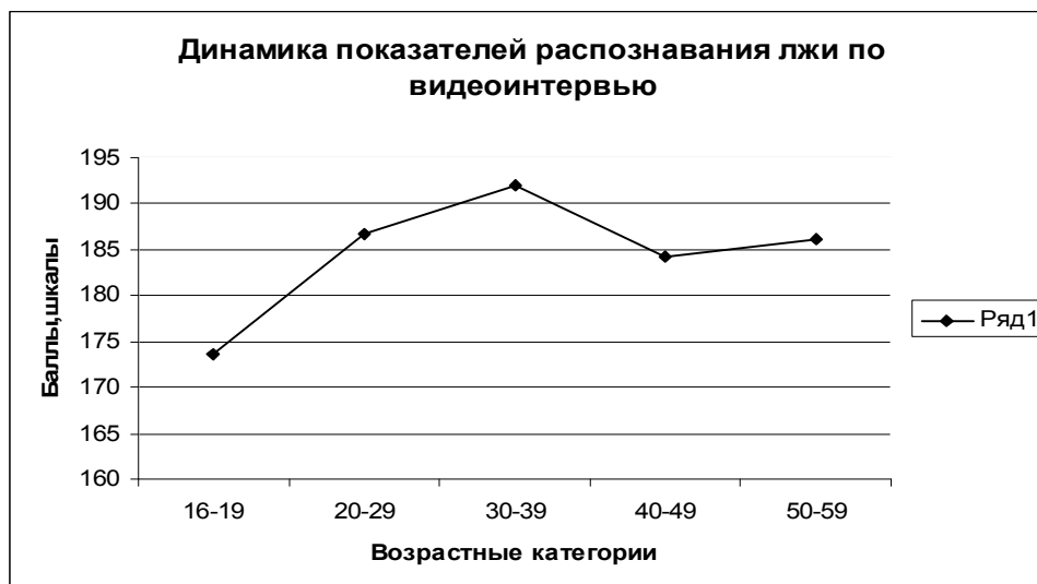
Рисунок 2. Динамика показателей распознавания лжи по видеоинтервью с учетом возрастных особенностей.

На графиках представлены результаты по точности и адекватности межличностного восприятия.